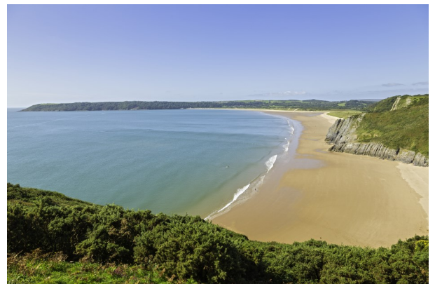
© Hawlfraint y Goron (2016) Croeso Cymru

disgwyl ichi fynd i gyfarfodydd y cylch gwleidyddol, hyfforddiant y blaid ac achlysuron eraill. Gallai cynghorydd gael ei benodi'n aelod o awdurdod gwasanaeth tân ac achub neu barc cenedlaethol. Byddai disgwyl iddo gynrychioli'r corff hwnnw yn y gymuned ac, yn ei gyfarfodydd, penderfynu ar faterion a goruchwyllo'r cyflawniad yn ogystal â rhoi gwybod i'r cyngor am benderfyniadau neu weithgareddau perthnasol.